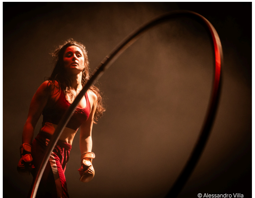
© Alessandro Villa Lontano; Marica; 2022