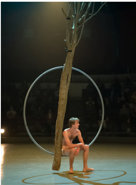
VIVANT échappée CNAC; Jef; 2022

A travers leur collaboration, ils se sentent de plus en plus liés par cette même obsession, laquelle les a individuellement conduit à approfondir à l'extrême deux faces de la même discipline. Ils se sentent inspirés par leur diversité et leur complémentarité de pensée, physique et culturelle.