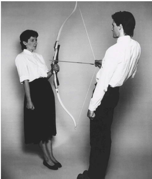
Marina Abramović Ulay - Rest Energy.

L'anatomie du corps et l'effleurement des limites sociales et physiques, se trouvent au sein de leur démarche. Ceci fait écho à notre projet. Leur travail performatif nous inspire car, au-delà du dépassement de soi, ils abordent le sujet de la relation homme-femme de manière déssexualisée.